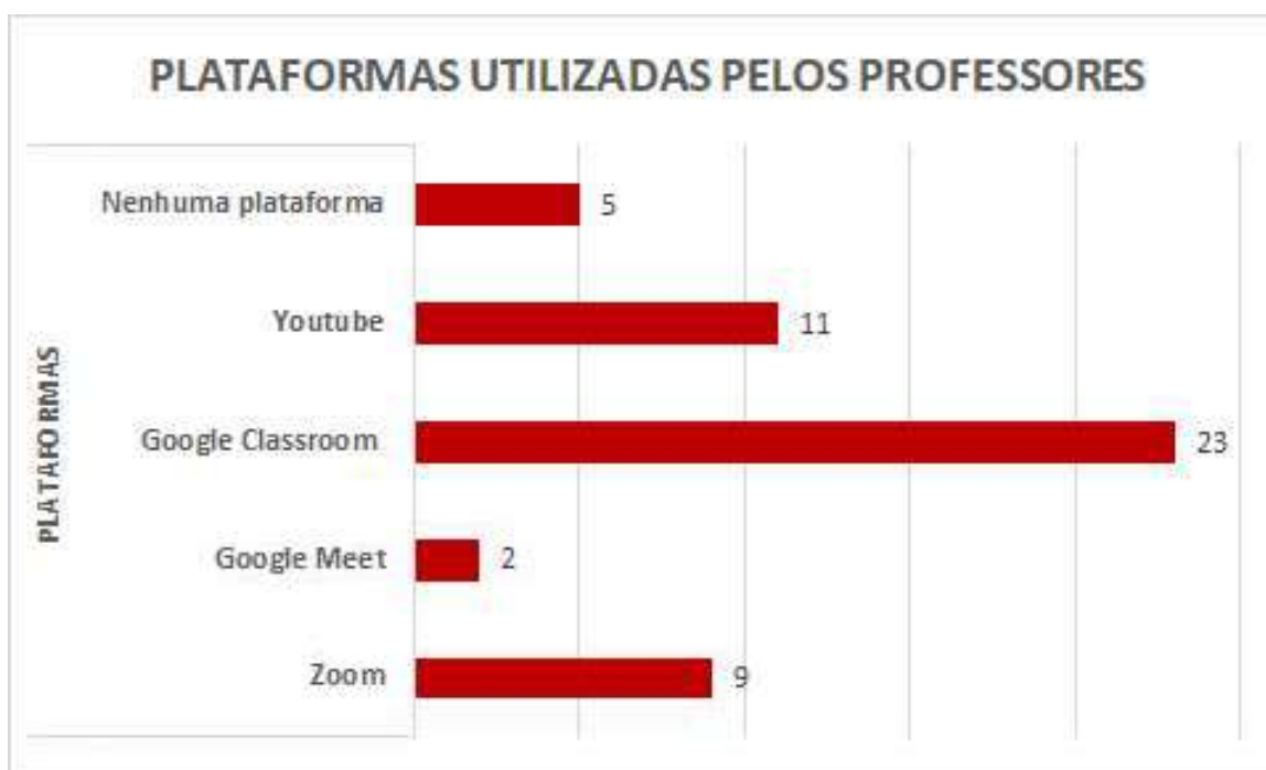
Figura 19.5: Plataformas utilizadas pelos professores

Quanto a percepção dos respondentes sobre: como são realizadas as formações de professores/reuniões pedagógicas no tempo de quarentena, ressaltaram: