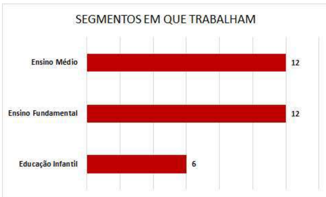
Figura 19.2: Segmentos em que trabalham

Verificou-se que todos os professores da rede privada, encontram-se em cargos públicos. E, 40% dos respondentes ministram aulas no Ensino Fundamental ou Ensino Médio, conforme figura, a seguir: