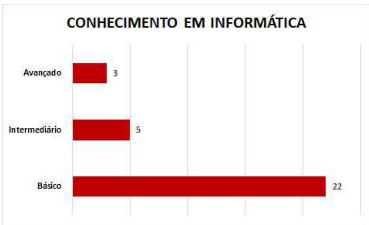
Figura 19.4: Conhecimento em informática.

Na sequência, analisou-se as “plataformas utilizadas pelos professores” nas aulas online. E verificou-se que, 16,66% dos respondentes informaram que suas escolas não estão utilizando nenhuma plataforma, apenas o WhatsApp para interagir e enviar os conteúdos em PDF aos alunos. Um deles (PRF 07) reconhece que, “sua maior dificuldade é falar de frente ao celular, gravar aulas no youtube e converter documentos do Word para PDF”. Conforme quadro, a seguir: